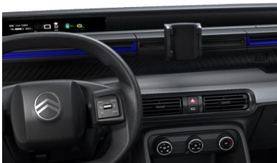
MY CITROËN PLAY (YOU)