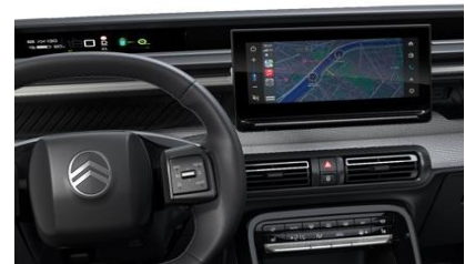
MY CITROËN DRIVE PLUS (MAX)