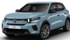
MONTE CARLO BLAU