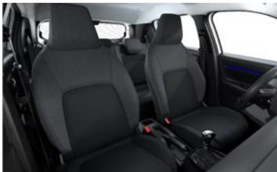
MICA GREY (YOU)