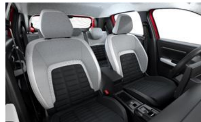
METROPOLITAN GREY (MAX)