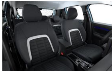
URBAN GREY (YOU Pack PLUS)