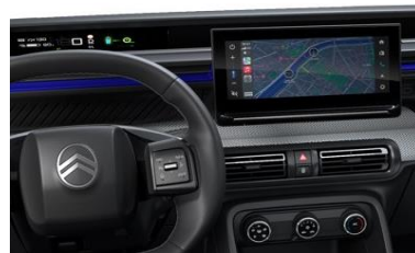
MY CITROËN PLAY PLUS (YOU Pack PLUS)