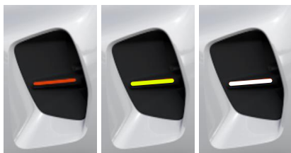
ANDRE ROT NEON GELB BANQUISE WEISS