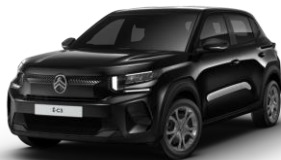
PERLA NERA SCHWARZ