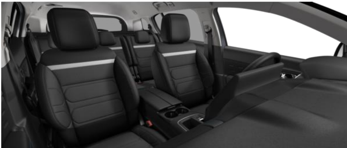
INNENRAUM METROPOLITAN BLACK