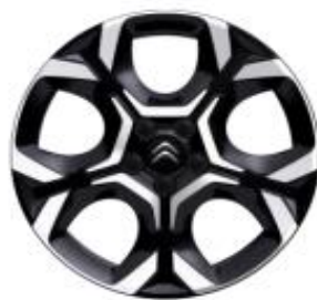
18 Zoll Leichtmetallfelgen PULSAR