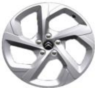
18 Zoll Leichtmetallfelgen SWIRL