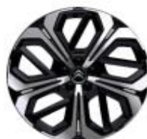
19 Zoll Leichtmetallfelgen AERO X BLACK DIAMOND glanzgedreht