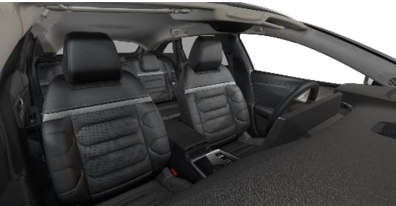
INNENRAUM HYPE BLACK