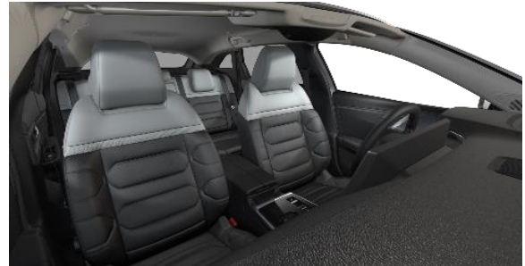
INNENRAUM METROPOLITAN BLACK