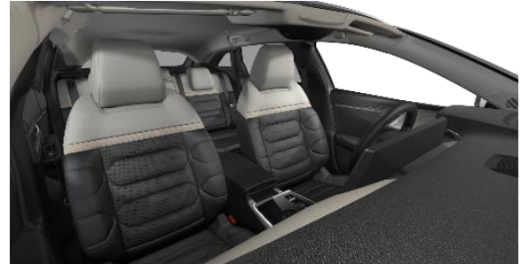
INNENRAUM HYPE ADAMANTIUM