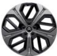
19 Zoll Leichtmetallfelgen AERO X silber/schwarz