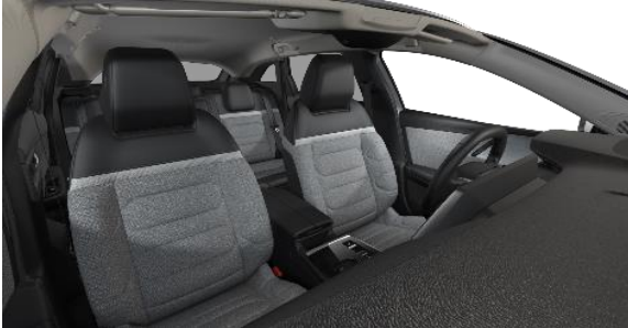
INNENRAUM URBAN GREY