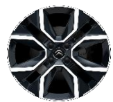
18 Zoll Leichtmetallfelgen HANOI