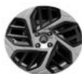
18 Zoll Leichtmetallfelgen CAMELIA grau