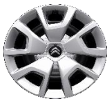
18 Zoll Stahlfelgen LOKI