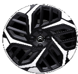
18 Zoll Leichtmetallfelgen CAMELIA 2-farbig