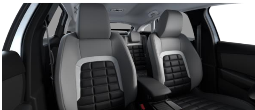
INNENRAUM METROPOLITAN GREY (PLUS)