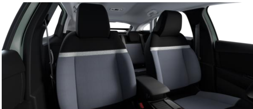
STOFF MEANWHILE SCHWARZ (YOU)