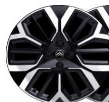
18 Zoll Leichtmetallfelgen AMBER