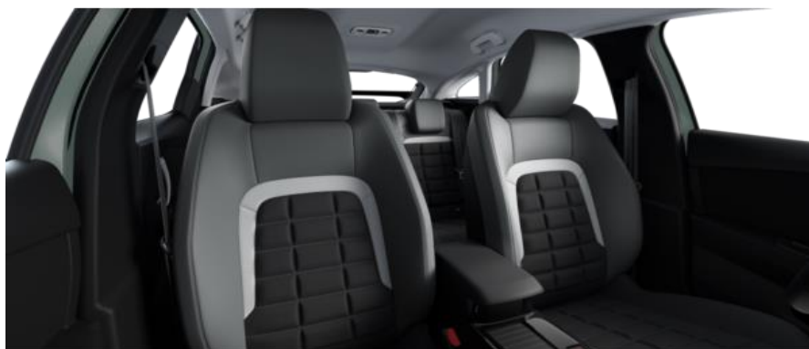
INNENRAUM URBAN GREY (MAX)