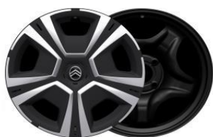
16 Zoll Stahlfelgen STEEL&STYLE