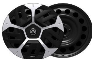
18 Zoll Stahlfelgen AREOTECH