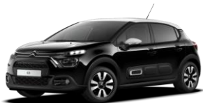
PERLA NERA SCHWARZ