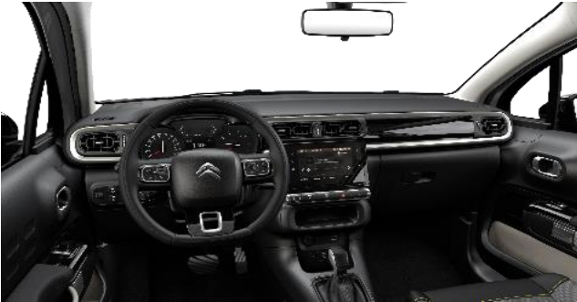
STOFF MICA GREY (SERIE)