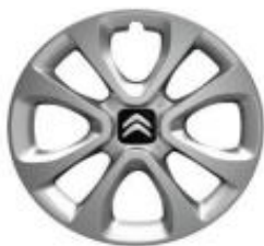
15 Zoll Stahlfelgen ARROW