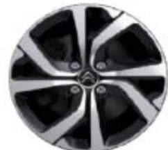
17 Zoll Leichtmetallfelgen MATRIX