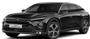
PERLA NERA SCHWARZ