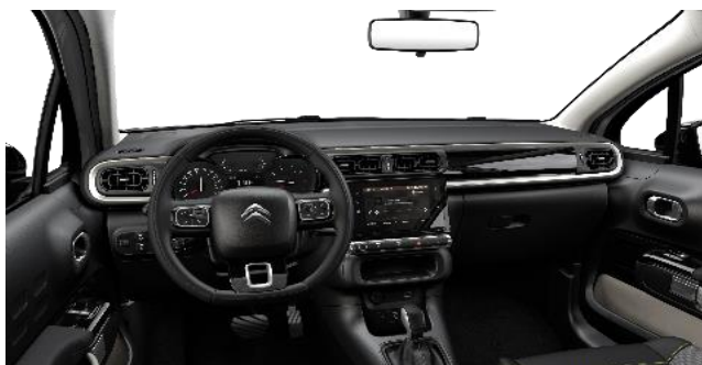
STOFF MICA GREY (SERIE)