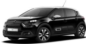
PERLA NERA SCHWARZ