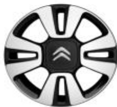
16 Zoll Stahlfelgen STEEL&STYLE