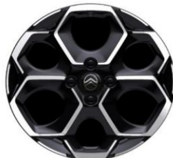
17 Zoll Leichtmetallfelgen ATACAMITE