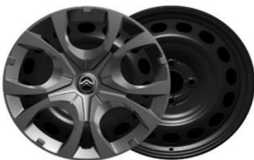
16 Zoll Stahlfelgen PYRITE