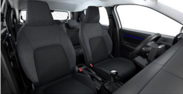
STOFF MICA GREY