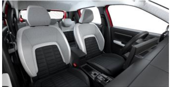
INNENRAUM METROPOLITAN GREY