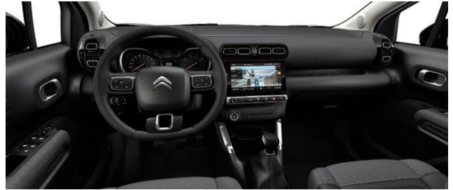
INNENRAUM METROPOLITAN GRAPHITE