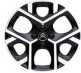
17 Zoll Leichtmetallfelgen ORIGAMI