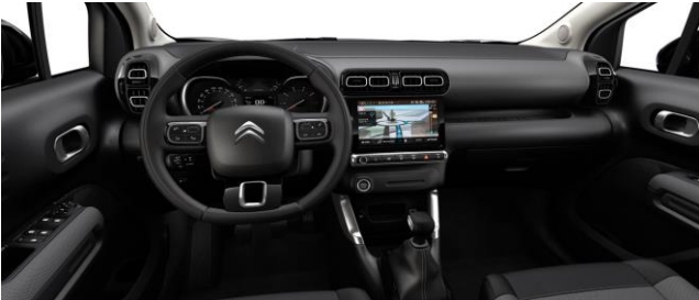
STOFF MICA GREY (SERIE)