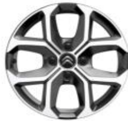
16 Zoll Leichtmetallfelgen XCROSS