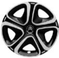
16 Zoll Stahlfelgen STEEL&STYLE