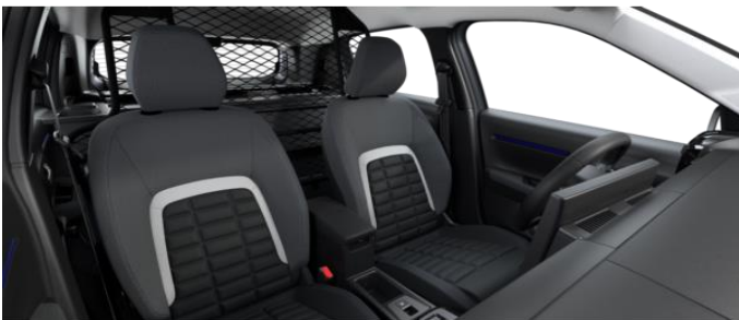
Ambiente URBAN GREY - Stoff Schwarz/Grau inkl. VAN Paket