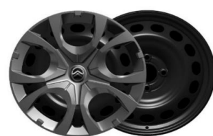
16 Zoll Stahlfelgen mit Radzierkappen PYRITE