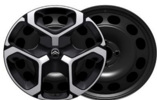
17 Zoll Stahlfelgen mit Radzierkappen AZURITE